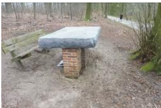
De Steenen Tafel