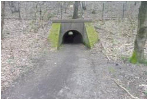
Het beroemde tunneltje, waar de jeep net onderdoor kon.