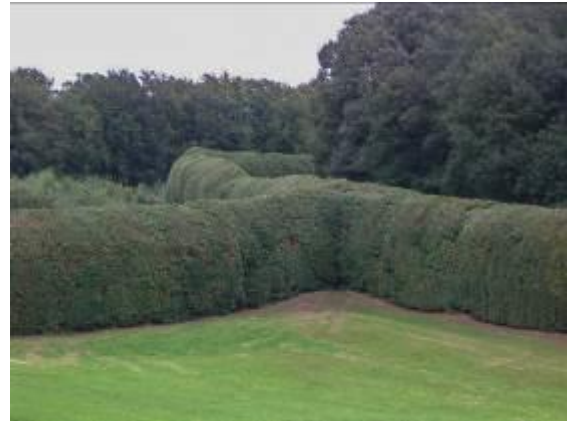
De Groene Bedstee