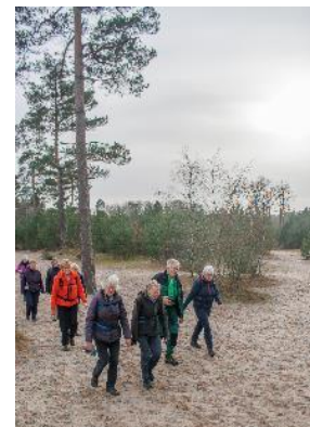
Toch nog zand!

Gelukkig voor ons, volgt Hette de route om het gehele gebied, waarbij we slechts een paar stukjes zandwoestijn voor de voeten krijgen. Wel gaat het op en af, wat het voor een aantal van ons al zwaar genoeg maakt. Halverwege de ronde wijken we even van de route af, om op een 'bergje' te genieten van de tweede 'wagenrust'. Daar dit punt niet bereikbaar is per auto, gaat de rugzak van Hette open en is er keus uit diverse chocolade versnaperingen. Weer vol energie lopen we richting de spoorbaan. Deze volgen we ruim een kilometer richting Soest. Een van de wandelaars doet hierdoor inspiratie op. Hij vertelt dat hij ooit op een baan bij de NS solliciteerde. Daar vroegen ze om dwarsliggers en spoorzoekers. Na een assessment werd hij echter afgewezen, omdat men vond dat hij niet spoorde. Zo zat dat stukje langs de spoorbaan er snel op voor de mensen wandelend in zijn buurt.