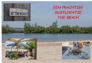
Genieten aan het water