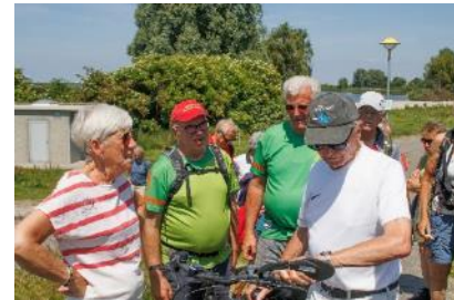
Even overleg voor vertrek