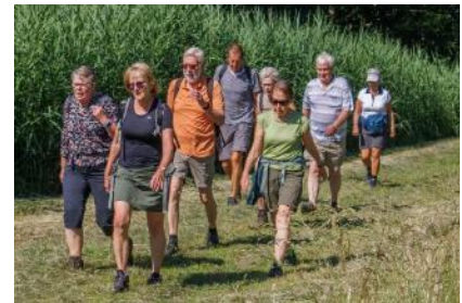
Wat een groen bij de stad