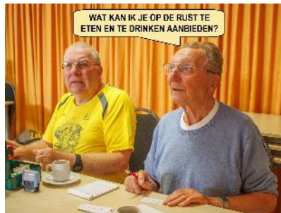
Ik trakteer vandaag