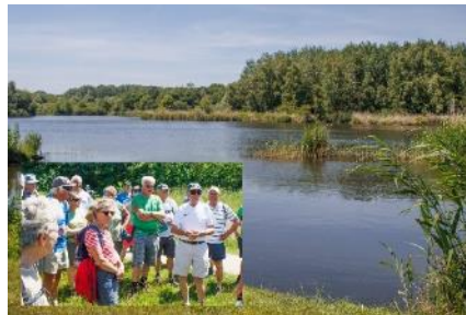
Uitleg bij de Zuigerplas